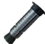
Cheville à expansion M8 ø 12 / percement 14mm