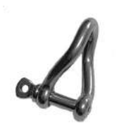
Manille torse x 1